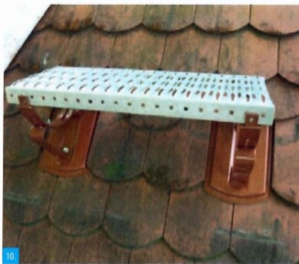
10. Pohled na kompletní usazenou plošinu do krytiny ve tvaru bobrovky šupinové pokládky.