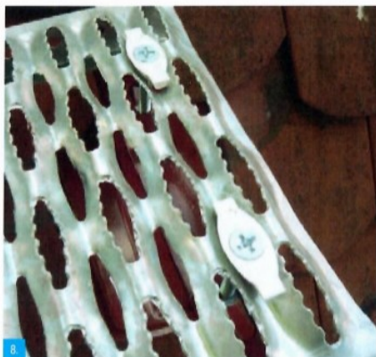
6. Na obrázku je vidět, jak zapadají olivy do prolisů v stoupací plošině, nenarušují povrchovou úpravu a mají lepší držení roštu oproti různým náhražkám. Pozor, šrouby mohou mít i otvor pro utahování na klíč imbus č. 6.