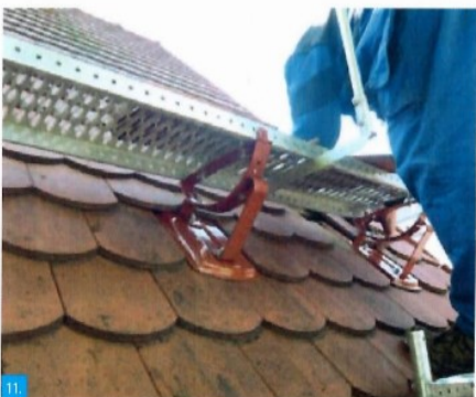
11. Pohled na montáž delší plošiny s přípravou pro usazení zábradlí.