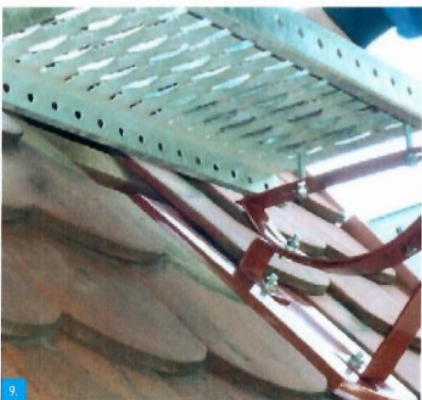
9. Pohled na spodní část roštu a jeho ukotvení ke kolebce. Je nutné vždy zkontrolovat dotažení všech šroubů na plošinu.